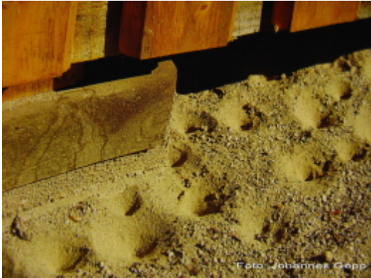
Abb. 1. Die Trichter der Ameisenlöwen liegen meistens an geschützten Stellen. Sie sind Fallen, um kleine Beutetiere zu fangen, häufig Ameisen