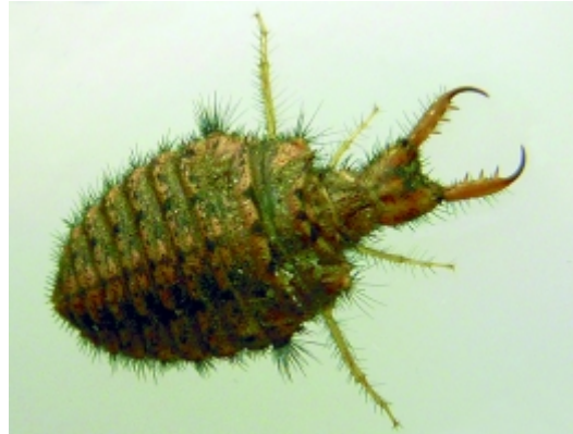
Abb. 2. Vom Ameisenlöwen sieht man in der Natur eigentlich nur die Zangen, die am Grund des Fangtrichters erkennbar sind