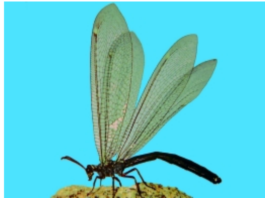
Abb. 4. Das erwachsene Tier ist libellenähnlich und wird Ameisenjungfer genannt. Sie hat relativ lange Fühler