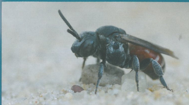
Ammobates punctatus

Voraussichtliches Ende der Tagung gegen 16:00 Uhr. (Programmänderungen vorbehalten!)